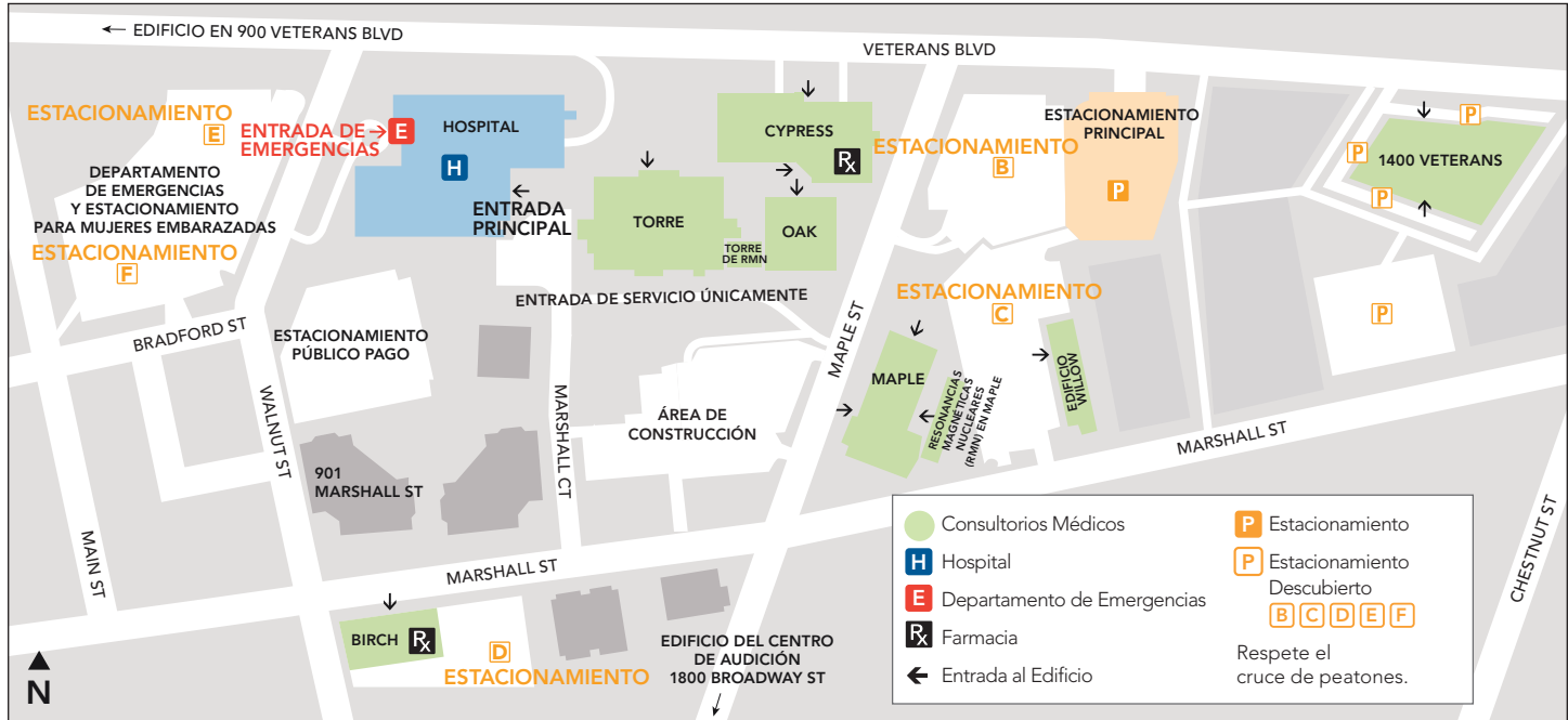
El mapa no está a escala.